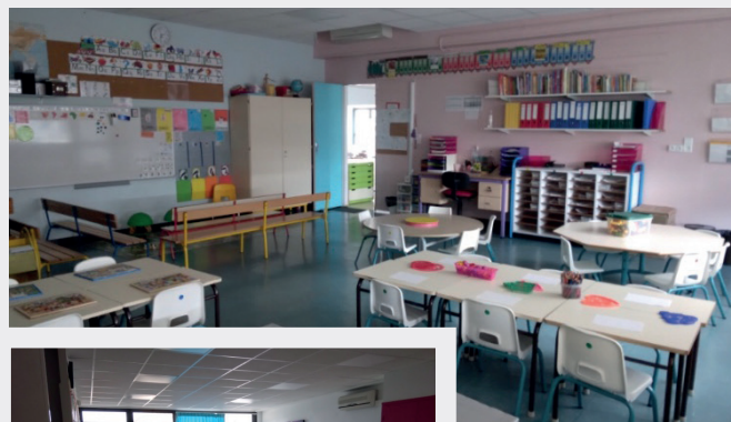
Classes de MOLLÉGÈS

À Saint-Rémy, pendant les mois d'été, les élèves souffrent de la chaleur. Le problème a été soulevé à de nombreuses reprises par les parents d'élèves lors de récents conseils d'école. La municipalité persiste dans son refus d'installer la climatisation dans les salles de classe et préfère installer des brise-soleils ou des ventilateurs. Un système de climatisation économe en énergie pourrait être installé.