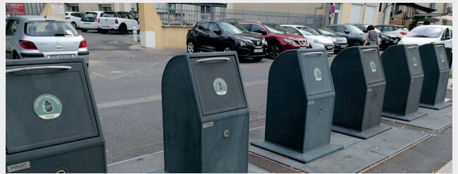
Colonnes enterrées de SALON

Comme d'habitude avec Hervé Chérubini, nous en sommes encore au stade de l'étude commandée cette fois-ci par la Communauté de Communes Vallée des Baux-Alpilles puisqu'il s'agit d'une compétence intercommunale.