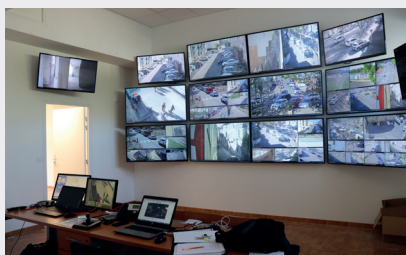
Centre de supervision de TARASCON

Saint-Rémy est l'une des très rares communes à ne pas être dotée d'un CSU. Nous proposons que soit installé, dans les locaux de la police municipale, un CSU qui permettrait de visionner en temps réel les images. Le Conseil Départemental des Bouches-du-Rhône pourrait le financer à hauteur de 70% , ce qui limiterait l'investissement pour la commune.