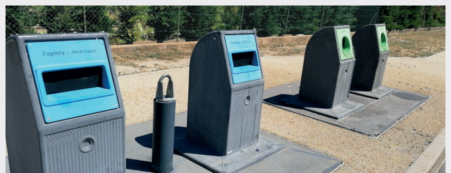
Colonnes enterrées de ROBION