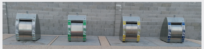
Colonnes enterrées de ORGON